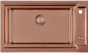
OUTLINE COPPER 6602 008